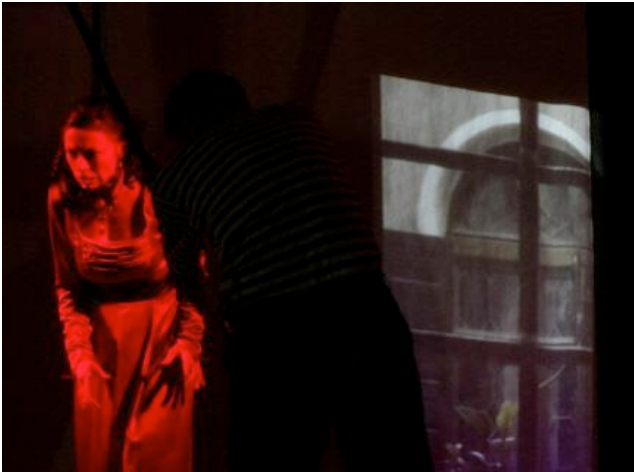
※"Maddalena" Sergei Prokofiev, Opera House Lotz, Poland, 20